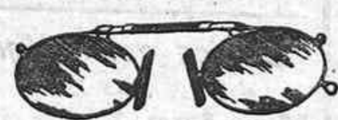
Lentes o Gafas de CRISTAL ROCA. 5 Pesetas.