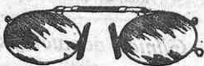
Lentes o Gatas de CRISTAL ROCA, 5 Pesetas.