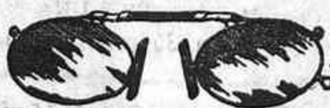
Lentes o Gatas de CRISTAL ROCA, 5 Pesetas.