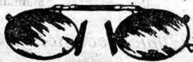
Lentes o Gatas de CRISTAL ROCA, 5 Pesetas.