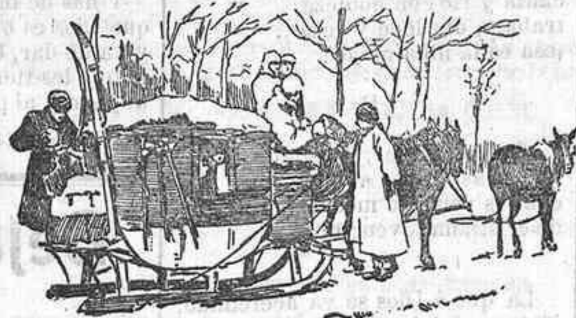
El trineo berlina, que en Rusia hace las veces de la antigua diligencia.

Potentados y menestrales, lo usan para trasladarse de un punto a otro, lo mismo dentro que fuera de