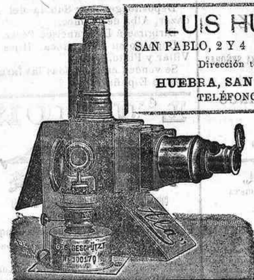
Aparatos de proyeccion completos, desde 125 pts.