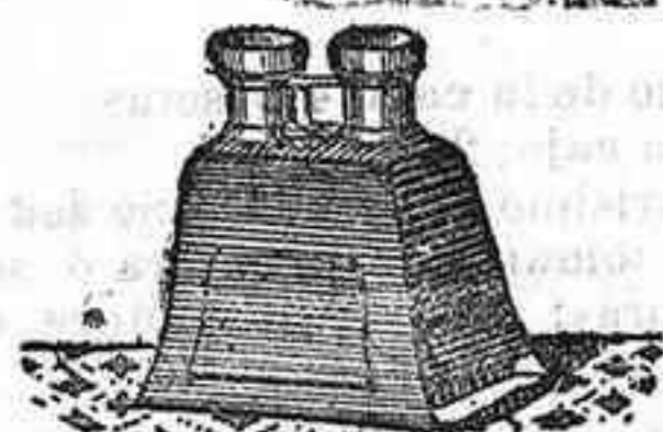
Stereoscopy y doce vistas exposicion de 1900, 12'50 PTS.

PLACAS Y PAPELES DE LUMIERE, GUILLENINOT, ST. CLAIR, LISSEGANG, AMERICANAS Y ALEMANAS