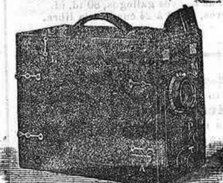
Le Ganga Le Lindo cosmos