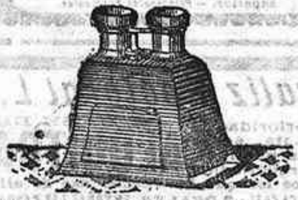
Stereoscopo y doce vistas exposición de 1900, 12'50 PTS.

PLACAS Y PAPELES DE LUMIERE, GULLENNOT, ST. OLAIR, LIESEGANG, AMERICANAS Y ALEMANAS