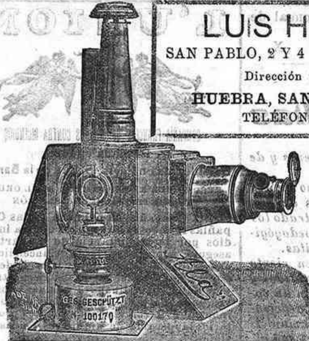
Aparatos de proyección, completos, desde 120 pts.