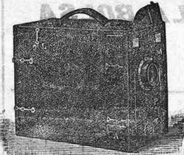
Le Ganga Le Lindo cosmos

PLACAS Y PAPELES DE LUMIERE, GUILLEMINOT, ST. CLAIR, LISEGGANG, AMERICANAS Y ALEMANAS