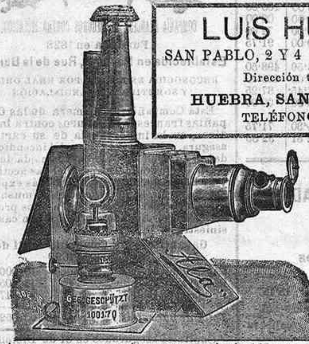
Aparatos de proyección completos, desde 125 pts.

LUIS HUEBRA SAN PABLO, 2 Y 4 SALAMANCA Dirección telegráfica: HUEBRA, SAN PABLO, 2 Y 4 TELÉFONOS, 88 Y 41