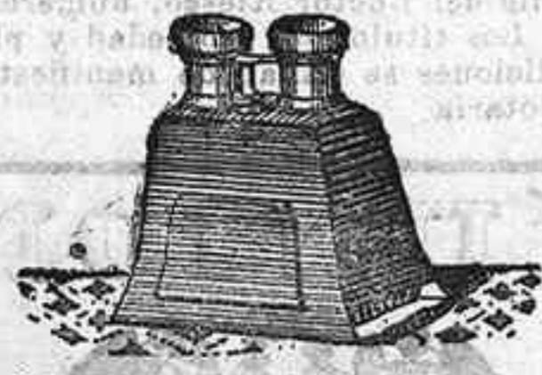
Stereoscopy y doce vistas de posición de 1900, 12'50 PTS.