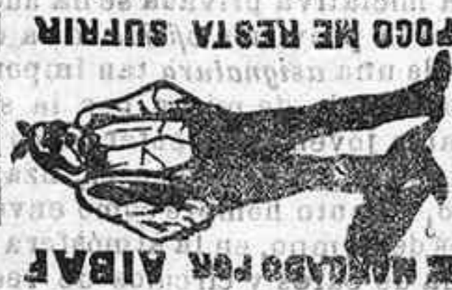
Se vende en Salamanca, farmacia de HIJOS DE VILLAR Y PINTO, plaza de la Verdura, 5, a DOS PESETAS BOTE.