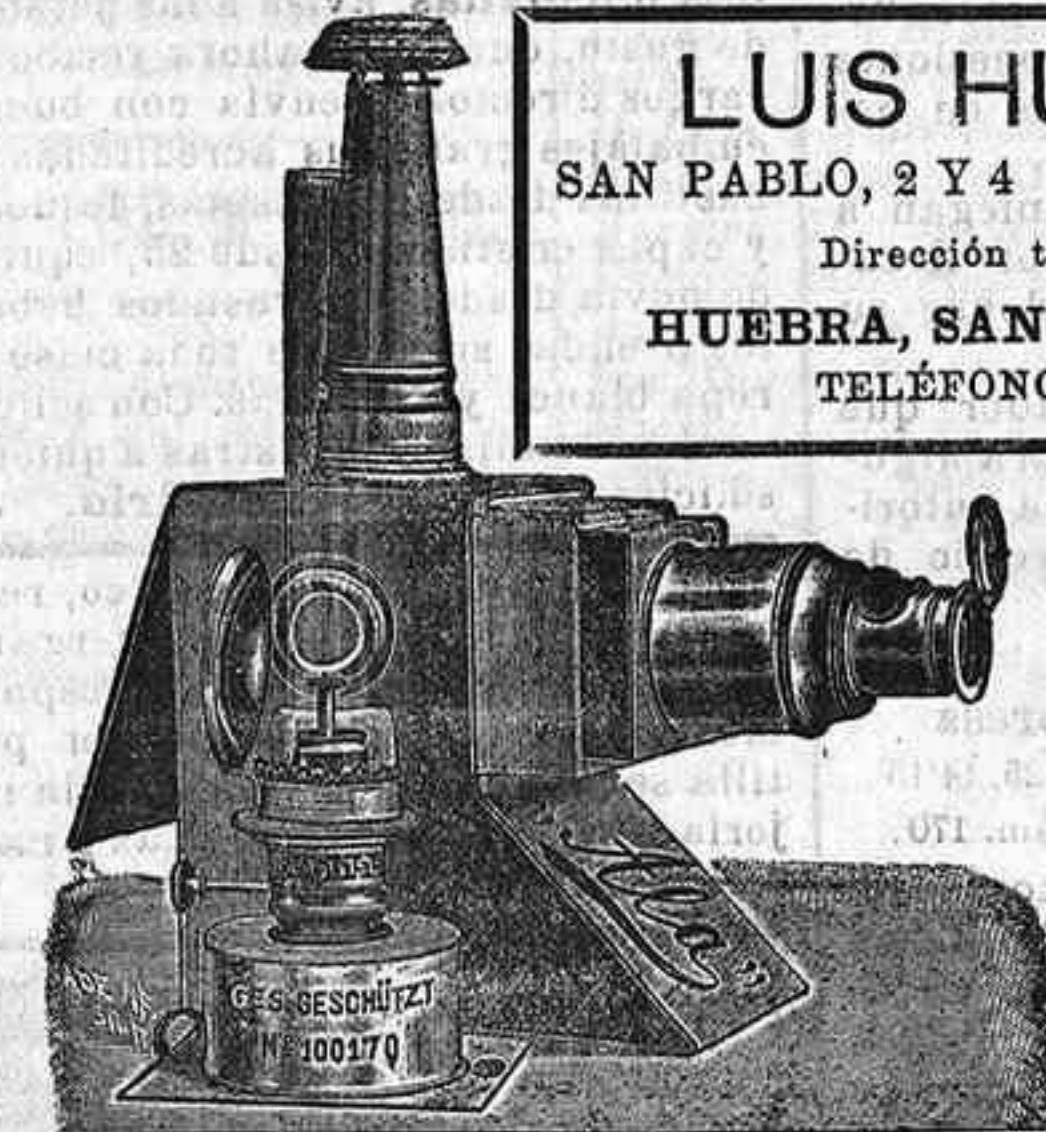
Aparatos de proyección completos, desde 140 pts.

LUIS HUEBRA SAN PABLO, 2 Y 4 SALAMANCA Dirección telegráfica: HUEBRA, SAN PABLO, 2 Y 4 TELÉFONOS, 38 Y 41