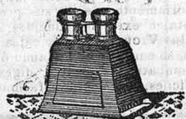
Stereoscopo y doce vistas exposición de 1900, 12'50 PTS.

PLACAS Y PAPELES DE LUMIERE, GUILLEMINOT, ST. CLAIR, LIESEGANG, AMERICANAS Y ALEMANAS