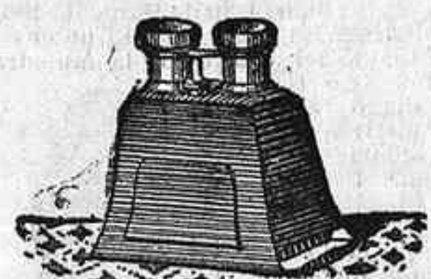
Stereoscopy y doce vistas exposición de 1900, 12'50 PTS.

PLACAS Y PAPELES DE LUMIERE, GUILLENINOT, ST. CLAIR, LIESEGANG, AMERICANAS Y ALEMANAS