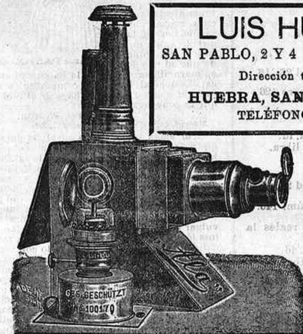
Aparatos de proyección completos, desde 120 pts.