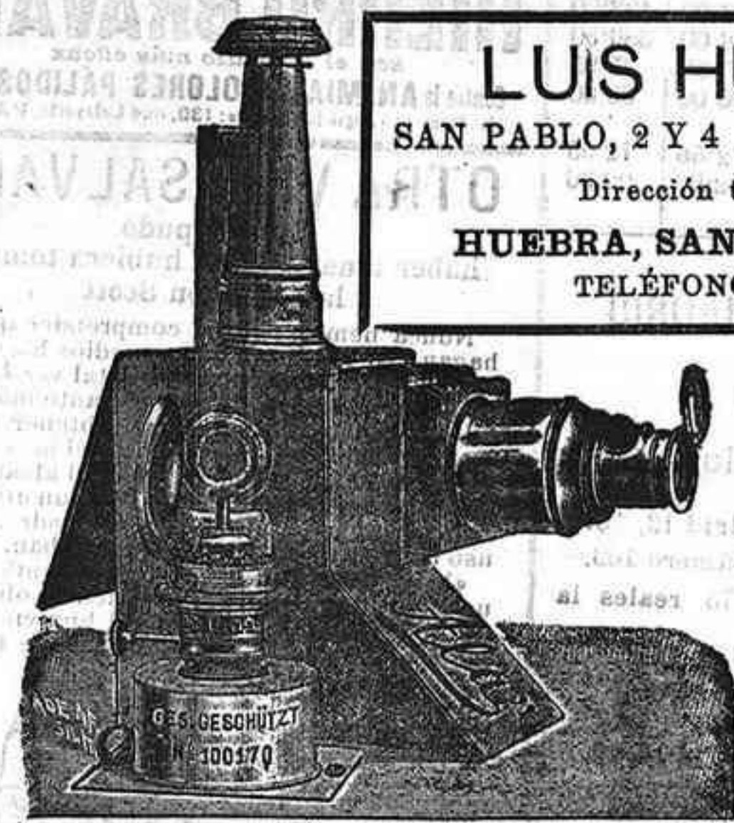
Aparatos de proyección completos, desde 120 pts.

LUIS HUEBRA SAN PABLO, 2 Y 4 SALAMANCA Dirección telegráfica: HUEBRA, SAN PABLO, 2 Y 4 TELÉFONOS, 88 Y 41