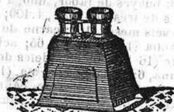
Stereoscoipo y doce vistas exposición de 1900, 12'50 PTS.

PLACAS Y PAPELES DE LUMIERE, GUILLENINOT, ST. CLAIR, LIESEGANG, AMERICANAS Y ALEMANAS