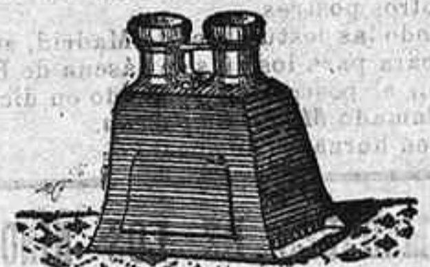
Stereoscopio y doce vistas exposición de 1900, 12'50 PTS.

PLACAS Y PAPELES DE LUMIERE, GUILLEMINOT, ST. CLAIR, LIESEGANG, AMERICANAS Y ALEMANAS