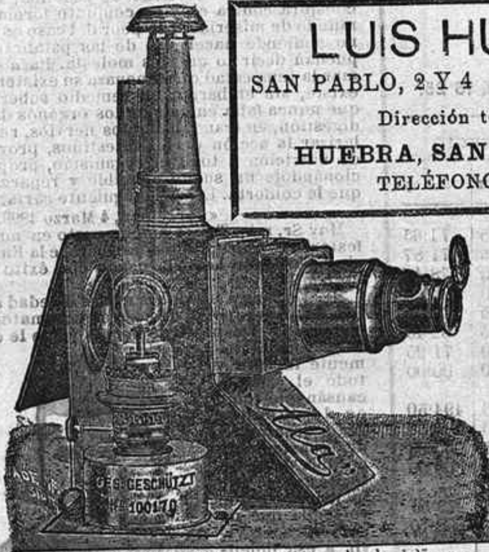
Aparatos de proyeccion completos, desde 125 pts.

LUIS HUEBRA SAN PABLO, 2 Y 4 SALAMANCA Dirección telegráfica: HUEBRA, SAN PABLO, 2 Y 4 TELÉFONOS, 88 Y 41