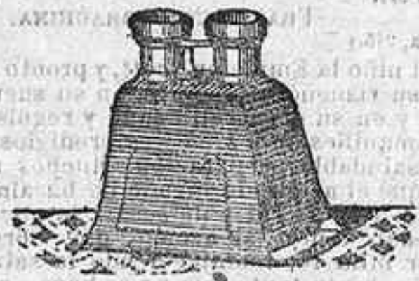
Stereoscopio y doce vistas exposición de 1900. 12'50 PTS.

PLACAS Y PAPELES DE LUMIERE, GUILLENINOT, ST. CLAIR, LIESEGANG, AMERICANAS Y ALEMANAS