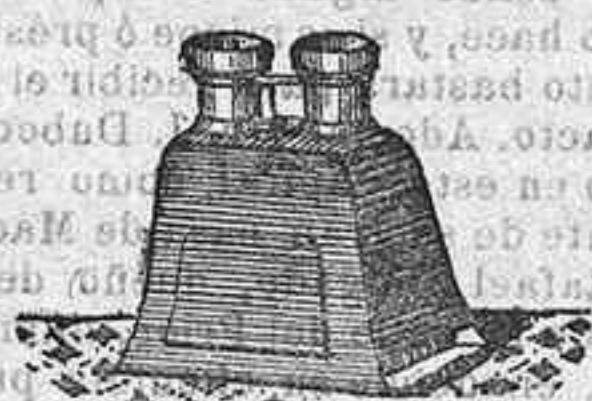
Stereoscopio y doce vistas exposición del 1900, 12 50 PTS.

PLACAS Y PAPELES DE LUMIERE, GUILLEMINOT, ST. CLAIR, LIESEGANG, AMERICANAS Y ALEMANAS