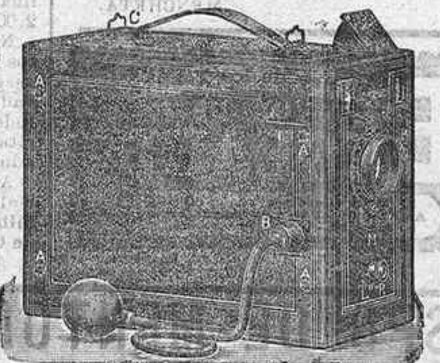
Detective de 6 h por 9 de 6 placas a 9 50

LA LE KINORA MARAVILLA DE LA EXPOSICIÓN DEL 900