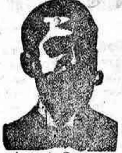
An golo Costanzi Bip. 435, Barcelona