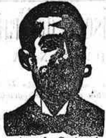
Angelo Costanzi Dip., 345, Barcelona

Preparación la más acionada para curar la tuberculosis, catarrós crónicos bronquitis infecciones gripales, enfermedades consuntivas, inapetencia, debilidad general, postración, nerviosa neurastenia, impotencia, enfermedades mentales, caries, raquitismo, escrofulismo etc. Frasco 2'50 pesetas. DEPÓSITO: Farmacia del Dr. Benedicto, San Bernardo 41, Madrid y en la provincia Salamanca, de farmacia del Licdo. Rodilla. - Guijuelo.