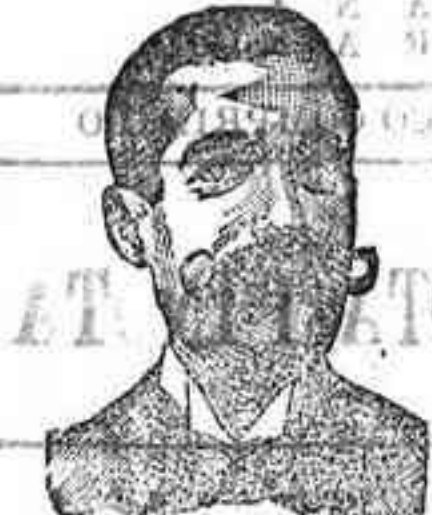
Angelo Costanzi Dip., 345, Barcelona

Depósito central del doctor ABRAS XIFRA , 10 Argensola—10, Farmacia, Madrid.—Véndese en Salamanca, en todas las farmacias y droguerías, en Filipinas: Roberts y Guamis, Manila.