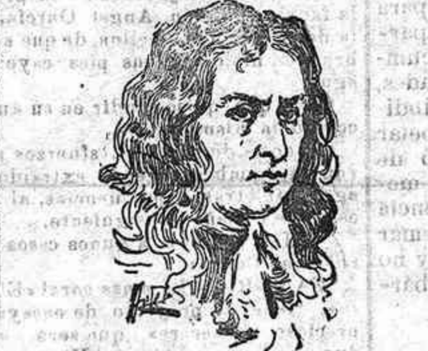
A la edad de 13 años hizo un magnífico retrato de Luis XIII a la pluma y sobre vitela, y tanto gustó al canciller de Francia que desde luego se declaró su protector, comenzando el oficio de tal, llevándose a Le