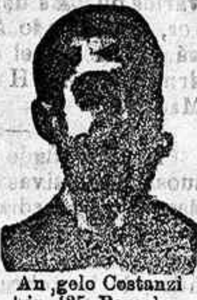
Angelo Costanzi Dip. 435, Barcelona

NOMAS TISIS Las Píldoras Artificias de Cuenca declaradas de utilidad universal SON la salvación de los enfermos DEL PECHO en sus diferentes períodos como lo prueban la multitud de testimonios que recibimos diariamente de eminencias médicas y de enfermos agradecidos. EVITAN á que los tubérculos del pulmón entren en supuración. CURAN rápidamente los catarros crónicos, los asma, y en especial la tisis. Caja 6 pesetas. Pídanse en todas las buenas farmacias. Depósito en Madrid: Farmacia de CUENCA, Colón, 14, 1.º