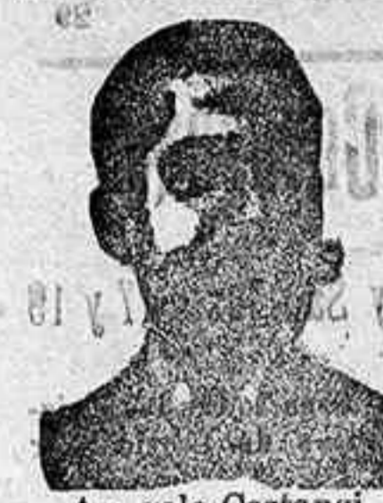
An. solo Costanzi Dip. 436, Barcelona

Especialísimas para mesa, solas ó con vino combaten y previenen dolencias del estómago, hígado, vías urinarias y recomendadas para los diabéticos y para los que padecen de postración, debilidad general, etc. Venta en Salamanca en todas las farmacias, y droguerías.