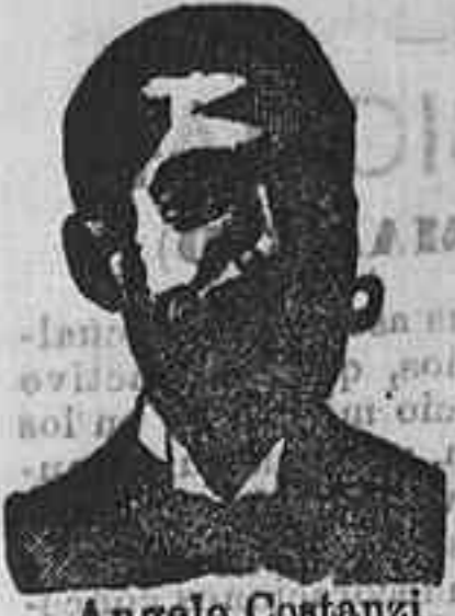
Angelo Costanzi Dip. 345, Barcelona

Preparación la más accional para curar la tuberculosis, catarros crónicos, bronquitis infecciones gripales, enfermedades consuntivas, insipetencia, debilidad general, postración, nerviosa, neurastenia, impotencia, enfermedades mentales, caries, raquitismo, escrofulismo etc. Frasco 2'50 pesetas. DEPÓSITO: Farmacia del Dr. Benedicto, San Bernardo 41, Madrid y en la provincia Salamanca, de farmacia del Lledo, Rodilla, Guijuelo.