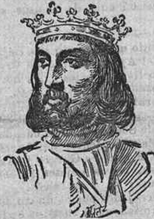
La paz de Évora tuvo como consecuencia inmediata el casamiento de don Juan I con la hija del rey de Portugal doña Leonor,

Don Juan I de Castilla, hijo de don Enrique II el Bastardo, recibió la corona de sus mayores en 1379, por muerte de su padre, y arrastrado por su bondad de corazón, prudencia y sabiduría, su primer cuidado fue dotar a su Estado de sabias leyes y dictar amplia amnistía, tarea en que fue sorprendido por la guerra que le declaró el duque de Lancaster, que ayudado por don Fernando de Portugal y por la gran Bretaña, pretendía ceñir a sus sienes la corona castellana, como había pretendido hacerlo en tiempos del rey Bastardo. Poderosos eran los enemigos con que don Juan tenía que pelear; mas la ayuda de Francia, cuya amistad cultivaba siguiendo los consejos de su padre, prestó importantes servicios y pudo entrar victoriosamente en el territorio lusitano, apoderándose de importantes poblaciones, hecho que indujo al portugués a concertar la paz de Évora, firmada en ocasión de hallarse ambos contendientes dispuestos a entablar en Yebres una batalla que podía ocasionar la completa derrota de los enemigos del rey castellano.