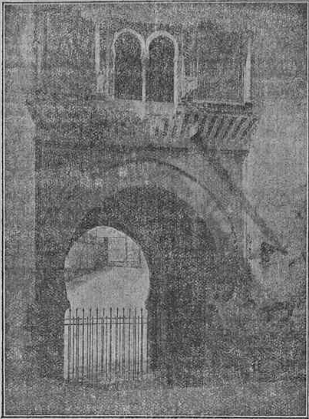
Alhambra — Puerta del Vino

Dejemos a la izquierda, y por ahora, el árabe palacio, y sigamos el contorno, prescindiendo de modernas construcciones, que ninguna particularidad ofrecen, y sin detenernos a investigar cuáles debieron existir de las ya derruidas, no penetremos en la