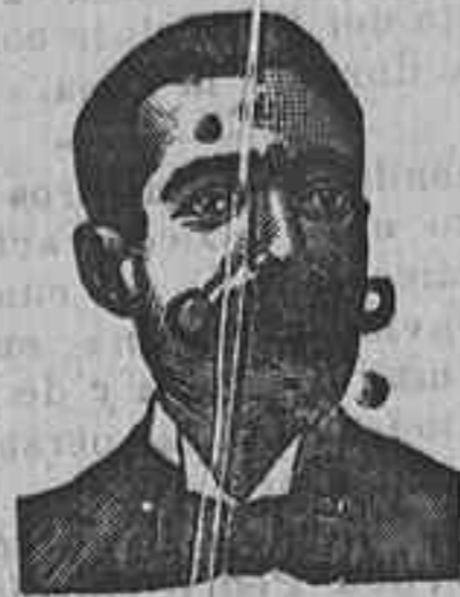
A. SALVATI COSTANZI

DEPÓSITO CENTRAL MONTERA NUM. 25.—MADRID