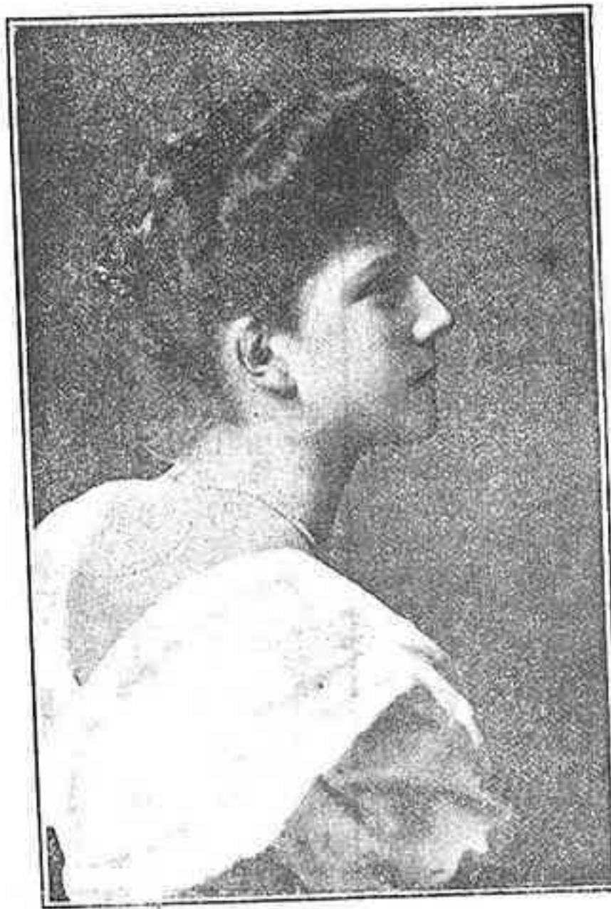
S. A. R. la Princesa Pilar.

Y, punto y aparte; la gratitud de ese regalo de gran señor con que ensalzo la fiesta Jacinto Benavente.