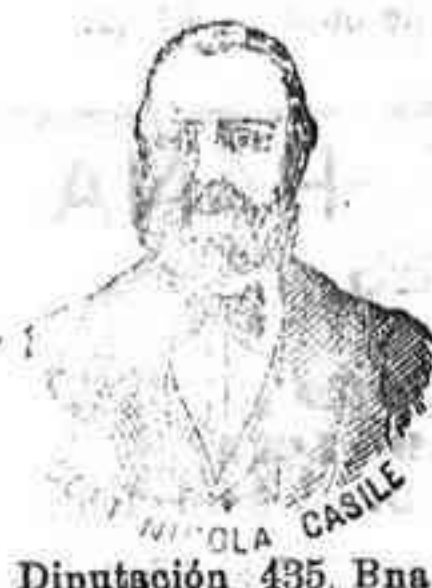
Diputación 435, Bna