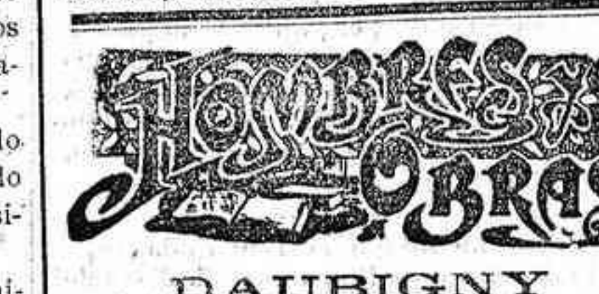
DAUBIGNY 20 de Febrero.

El herido es casado. Los médicos han declarado las lesiones de pronóstico reservado.