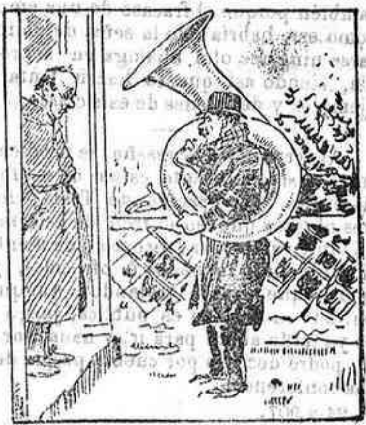
Peró hombre, D. Scriffo, no tiene usted compasión; ¡me da trayendo el trombón igual remuneración que cuando traigo el flautín!

Supongo que esta será conferencia, en desierto.