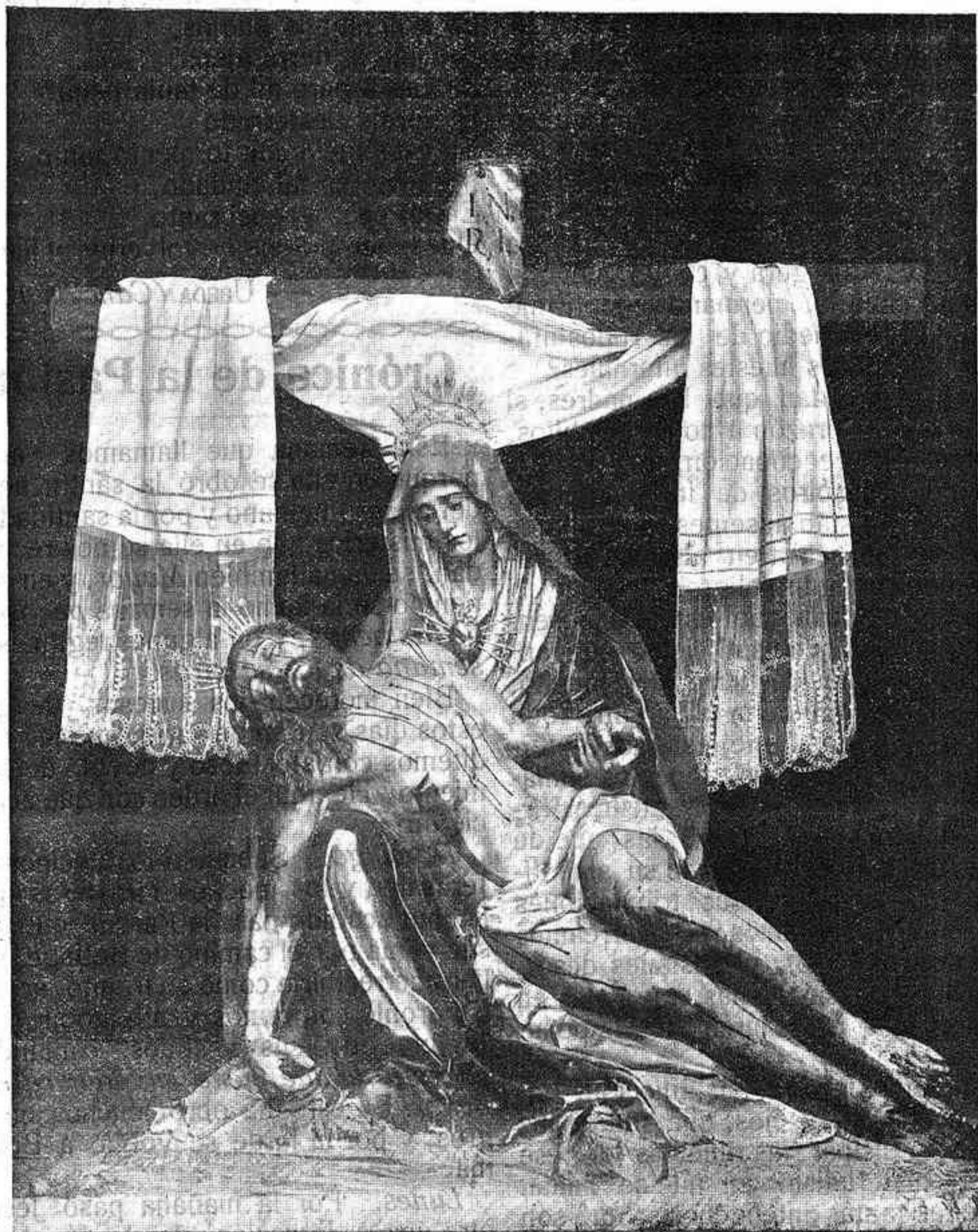
Nuestra Señora de las Angustias

Artística Imagen que se venera en la Iglesia de Santa María