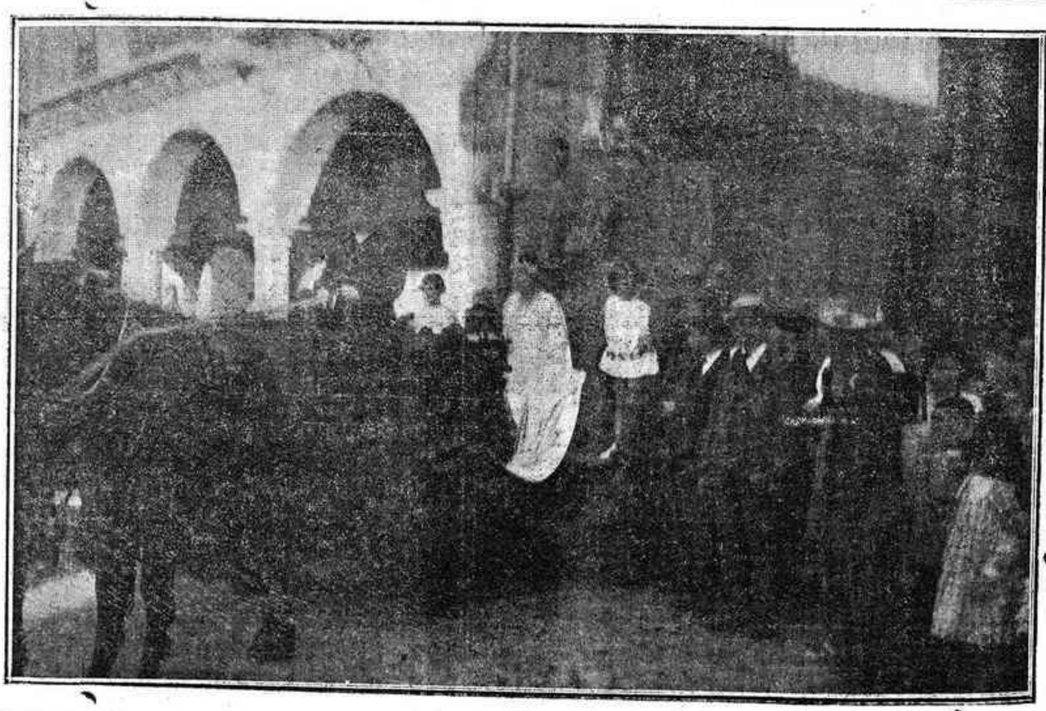
La carroza de la Reina a su paso por la Plaza Mayor