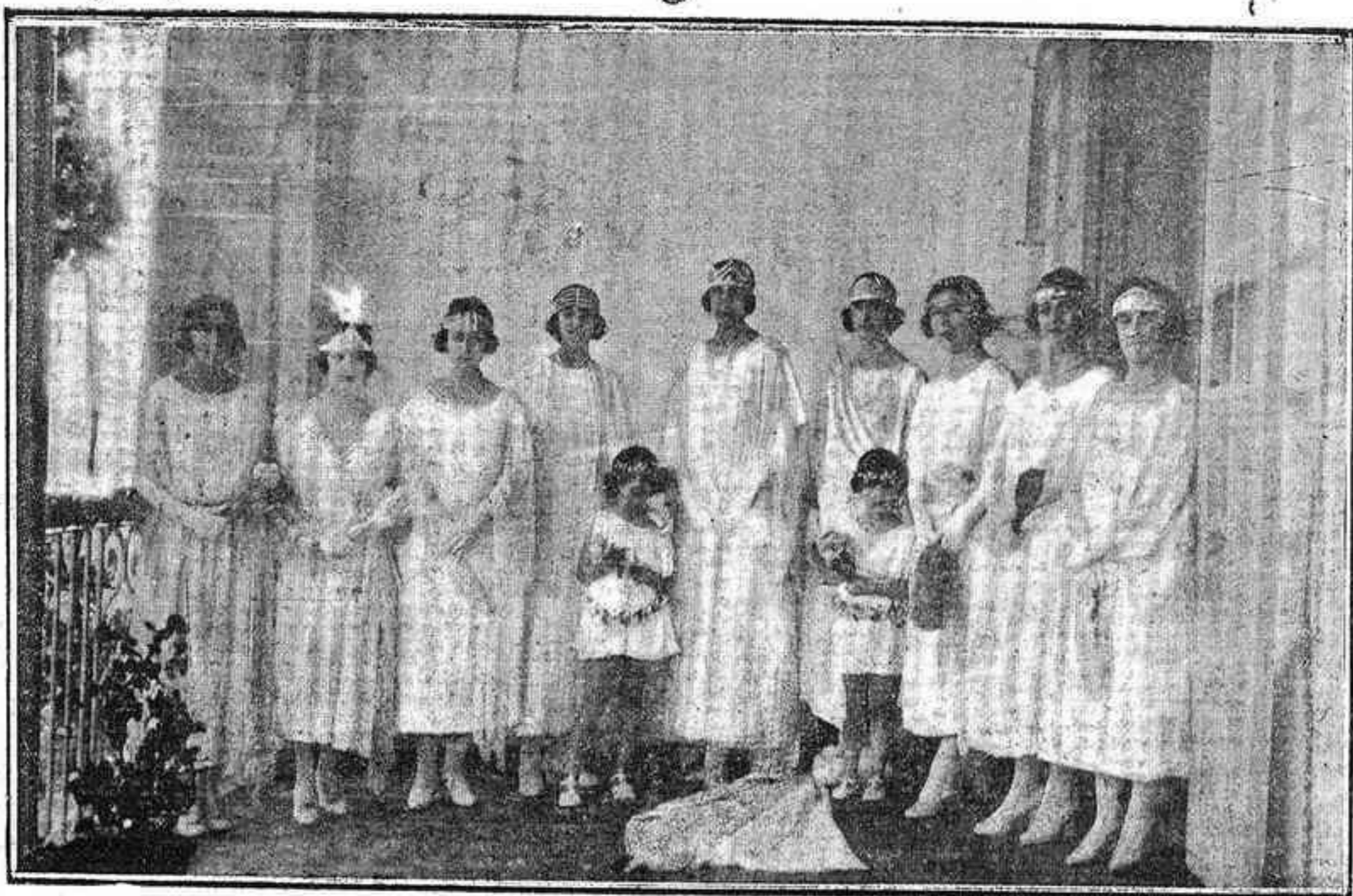
Un grupo de la Reina y su corte de Amor en el domicilio de aquélla