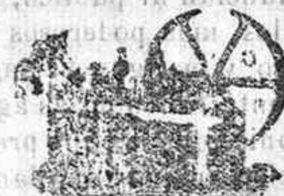
Máquina de vapor