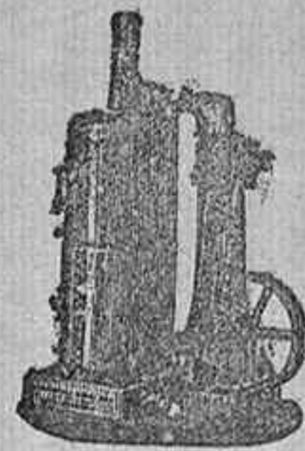
MAQUINA DE VAPOR VERTICAL.

Catálogos gratis y franco á quien los pida.