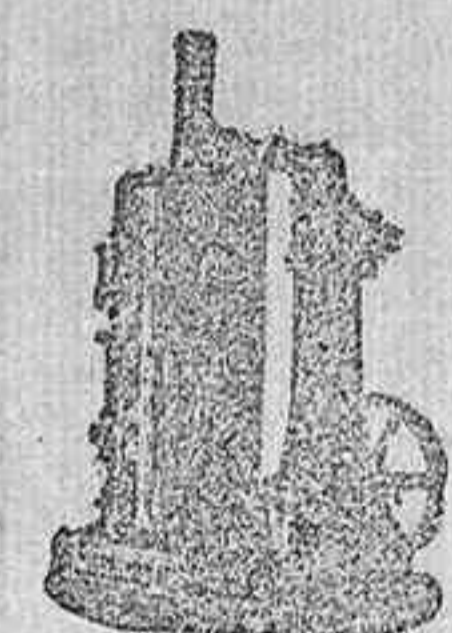
MAQUINA DE VAPOR VERTICAL.

Catálogos gratis y franco á quien los pida.