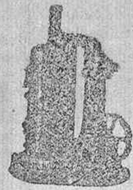
MAQUINA DE VAPOUR VERTICAL.

Catálogos gratis y franco á quien los pida.