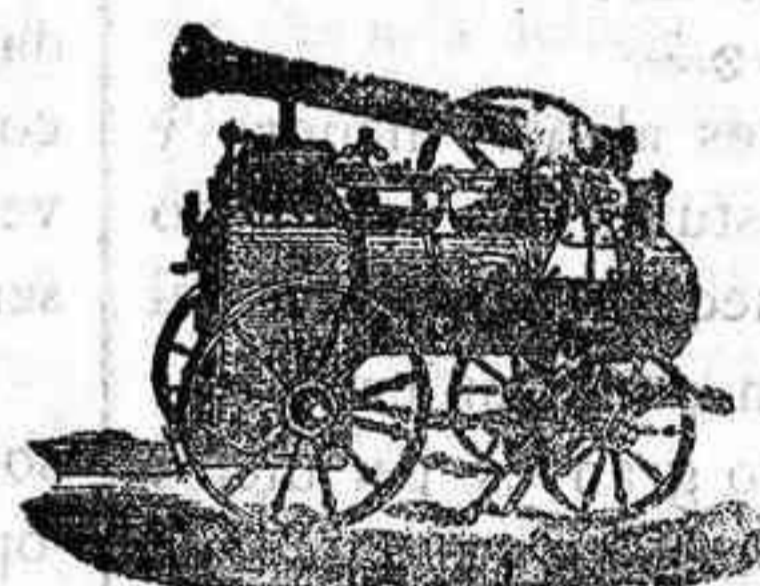
Máquina de vapor locomovil

Máquinas de vapor. — Bombas. — Pesas. — Tubos de todas clases. — Aparatos para hacer gaseosas y toda clase de maquinaria.