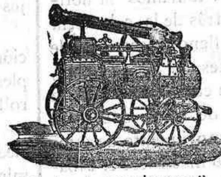
Máquina de vapor locomovil

Máquinas de vapor.—Bombas.—Pesas.—Tubos de todas clases.—Aparatos para hacer gaseosas y toda clase de maquinaria,