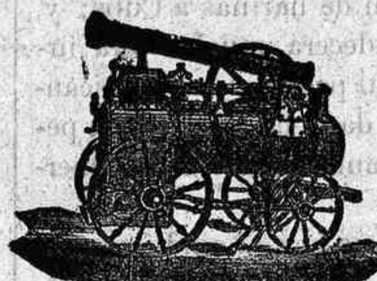
Máquina de vapor locomóvil

Máquinas de vapor, Bombas, Presas, Tubos de todas clases, aparatos para hacer gaseosas y toda clase de maquinaria.