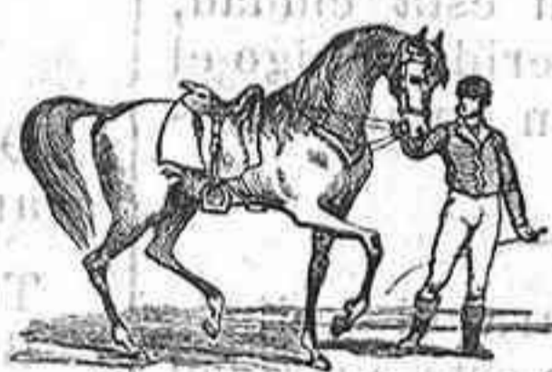
El caballo andaluz

Infinidad de caramelos.—Preciosas cajas para regalos.—Pasteles variados todos los días.—Riquisimas tartas.—Variados platos de postres.