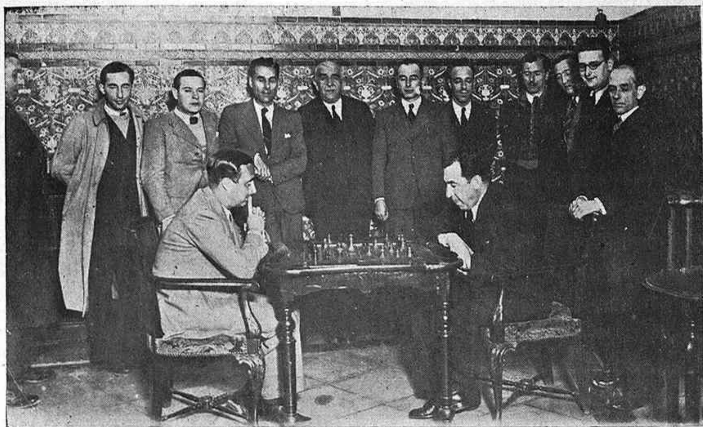
Inauguración del Campeonato de Ajedrez, recientemente jugado en el Círculo de la Amistad de Córdoba y donde han intervenido los mejores jugadores de esta capital.