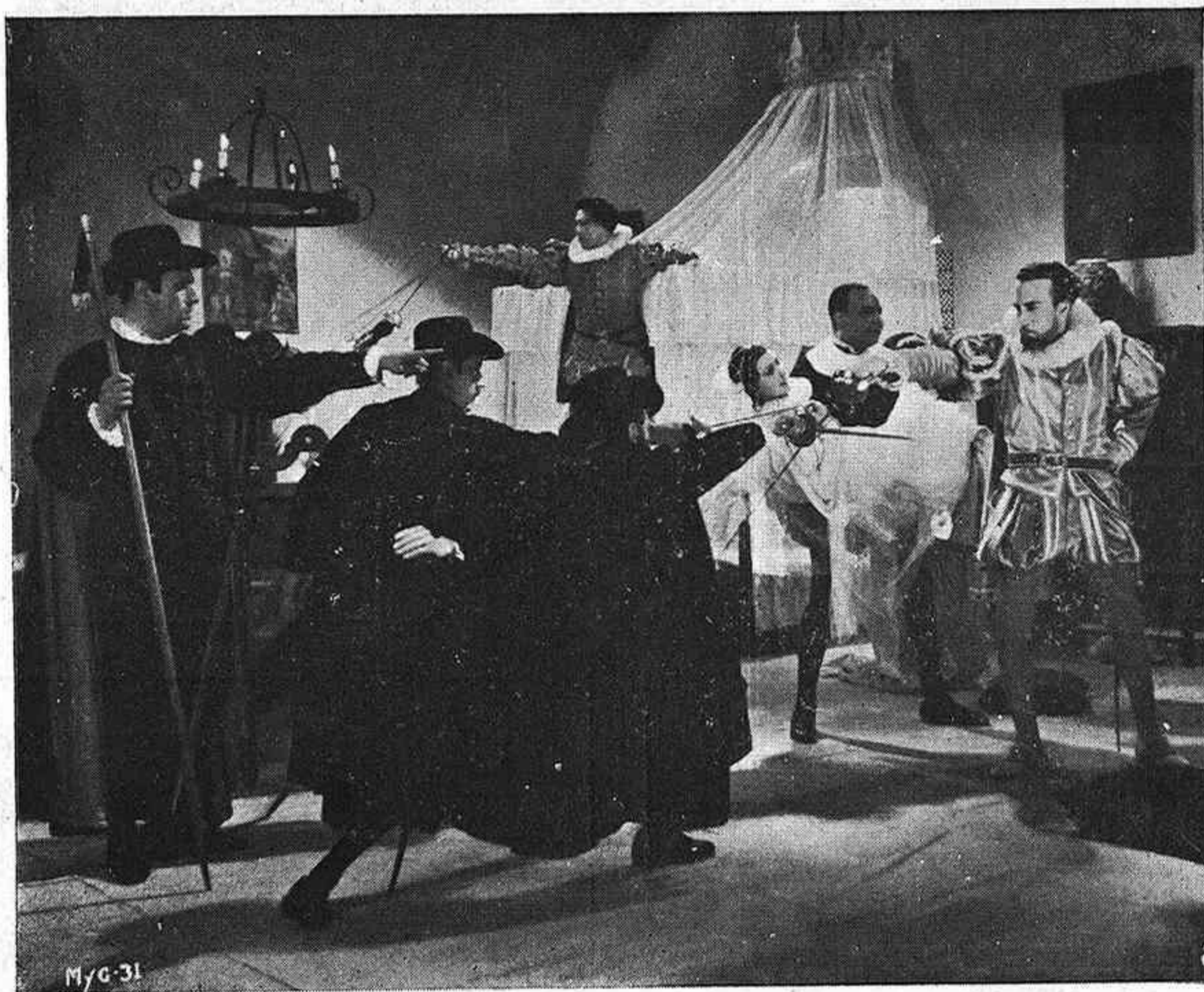
Una emocionante escena de la producción Cifesa MONJA Y CASADA; VIRGEN Y MARTIR.

Para obtener una sensación de máximo realismo, el esfuerzo de Cifesa no ha vacilado ante límites económicos. Y así, la instalación en Madrid de una tercera parte del tranquilo vecindario de Villavieja