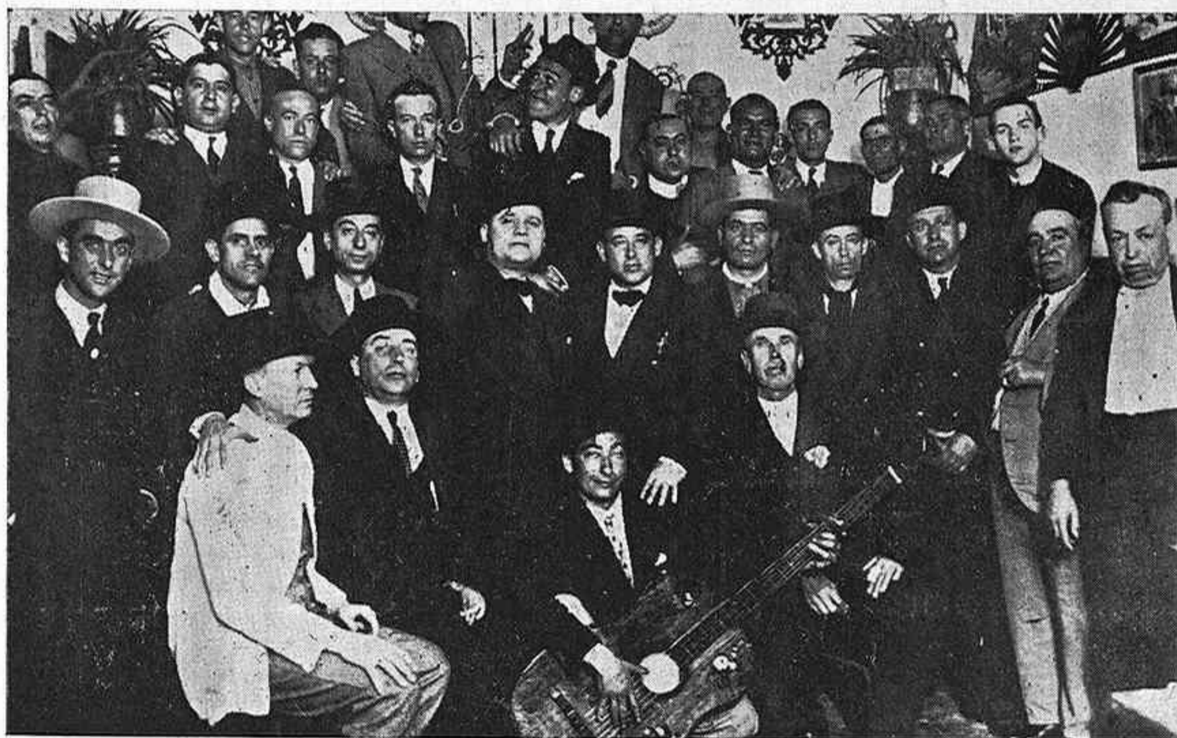
Grupo de algunos de los componentes de la ya popular y célebre «Peña de los noventa y nueve», ataviados con el clásico sombrero cordobés.