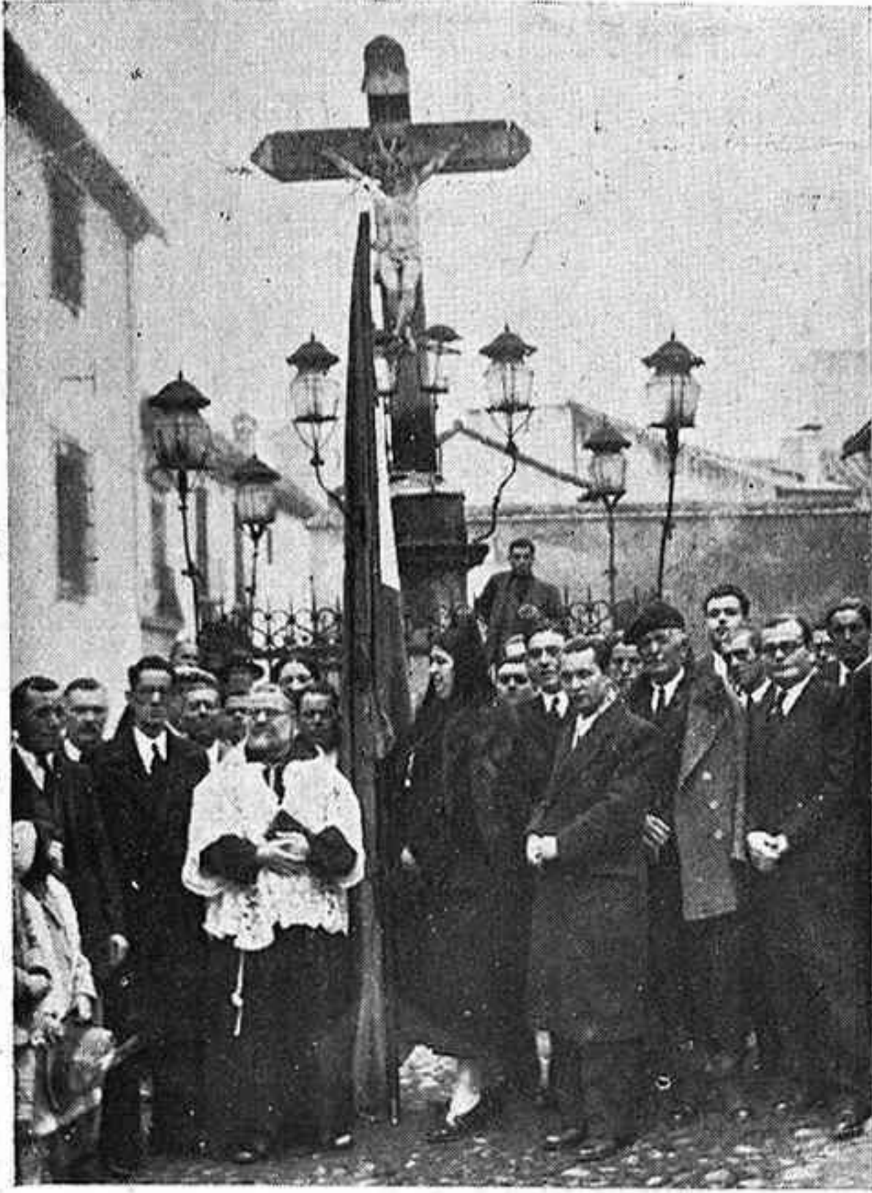
Acto de la bendición y entrega de la bandera de Acción Obrerista de Córdoba, celebrado en la típica plaza de los Dolores, el pasado Domingo día 8 del actual.