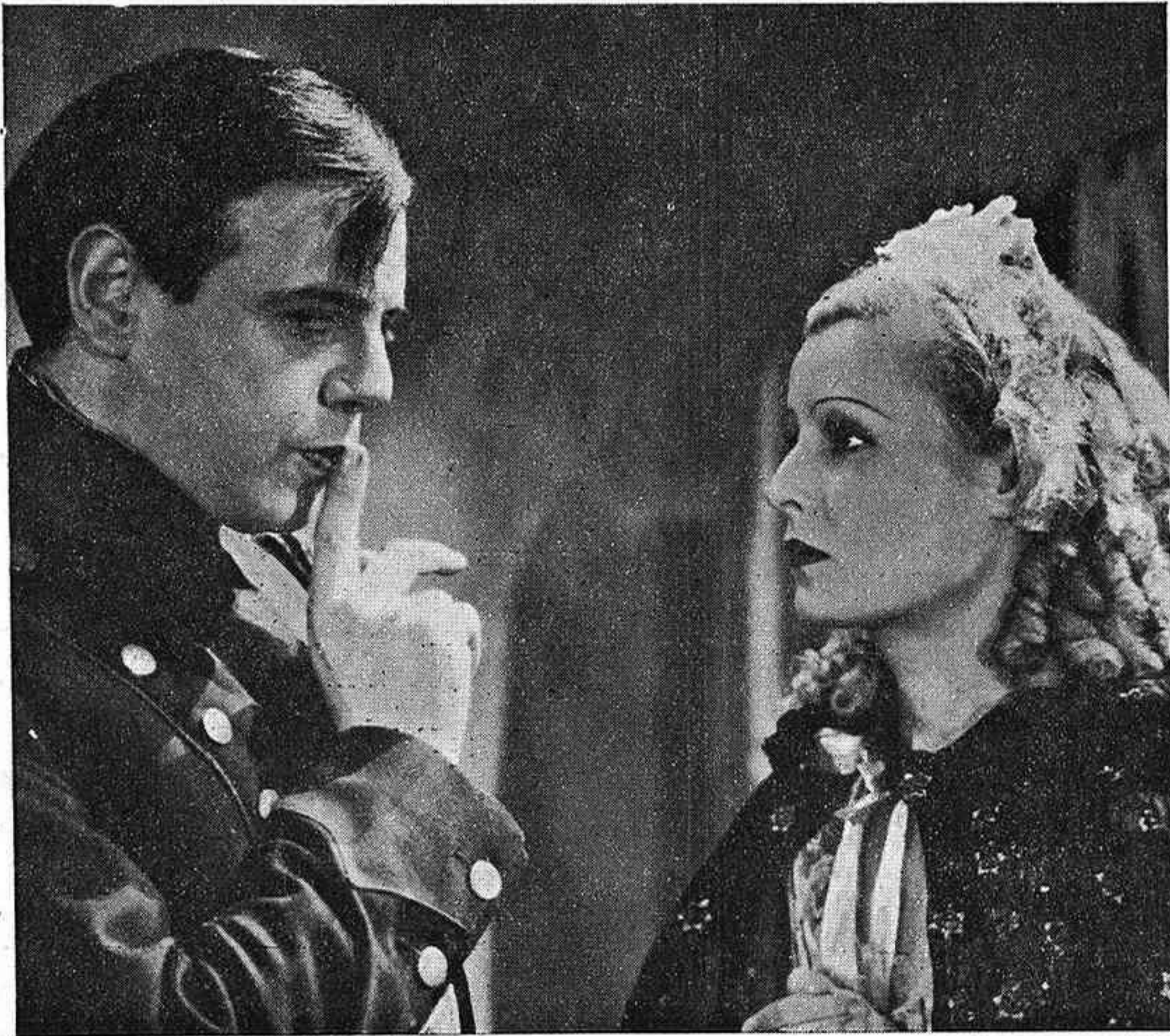
Una escena de la producción British «LA BAILARINA DEL CONJUNTO» protagonizada por Lilian Harvey y distribuida por CIFESA.

Con ella—con LA HIJA DEL PENAL—puede tener la seguridad nuestro público que no existen preocupaciones, con-