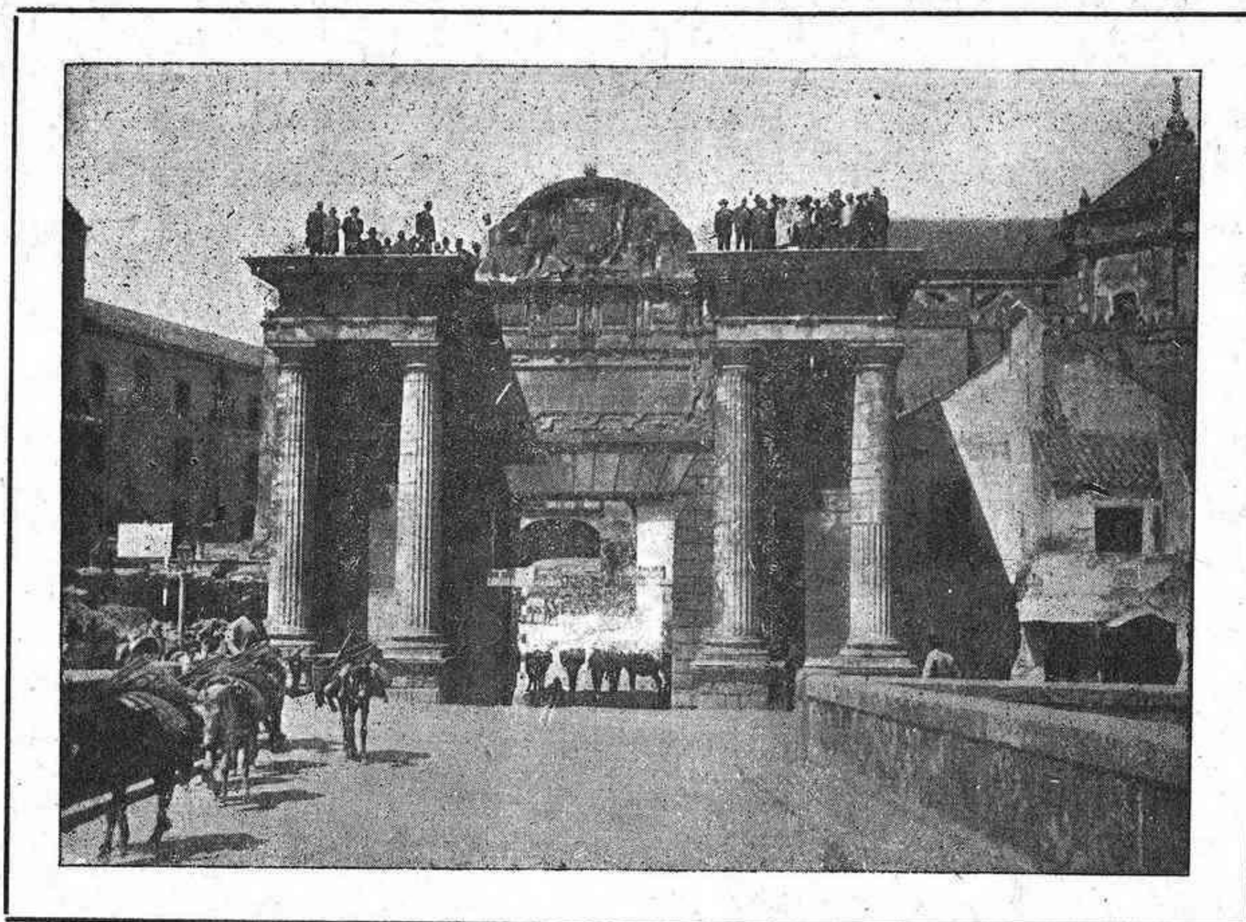
CÓRDOBA: Entrada del Puente Romano

Organo de la Federación de Sindicatos Católico-Agrarios de Córdoba