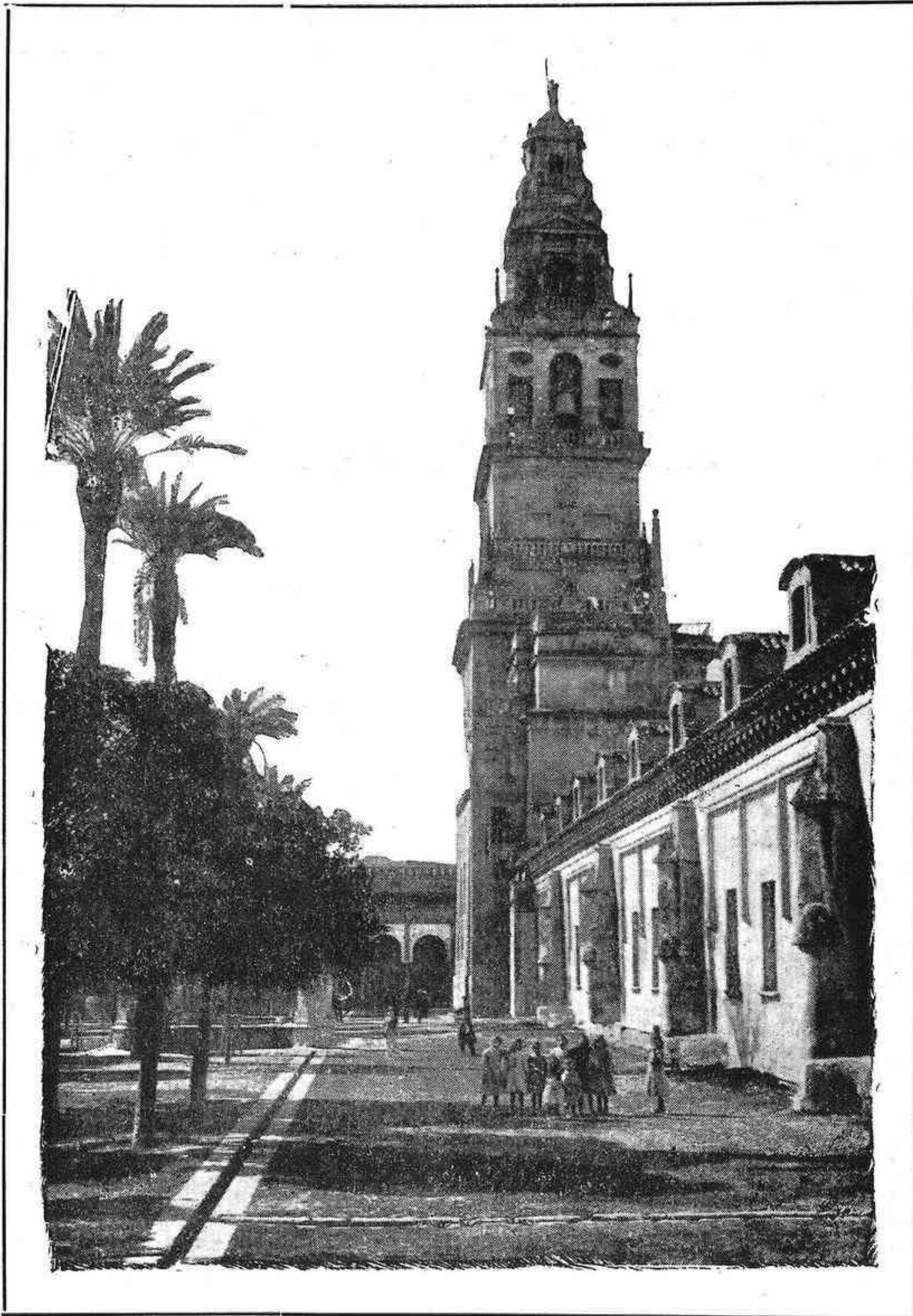
CÓRDOBA: La Catedral. — Torre y Patio de los Naranjos

Órgano de la Federación de Sindicatos Católico-Agrarios de Córdoba