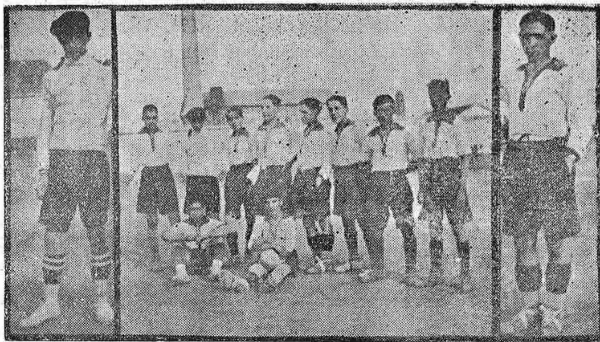
En el centro. El notable equipo infantil del Iliturgi F. C., que no ha sido vencido aún por ningún contrario. A los lados. Alés, guardameta y Cruz, capitán de dicho equipo.