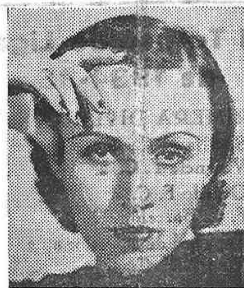
Berta Singerman, la insigne recitadora que el próximo lunes se presentará en el Cine Gónaga, a las siete de la tarde.