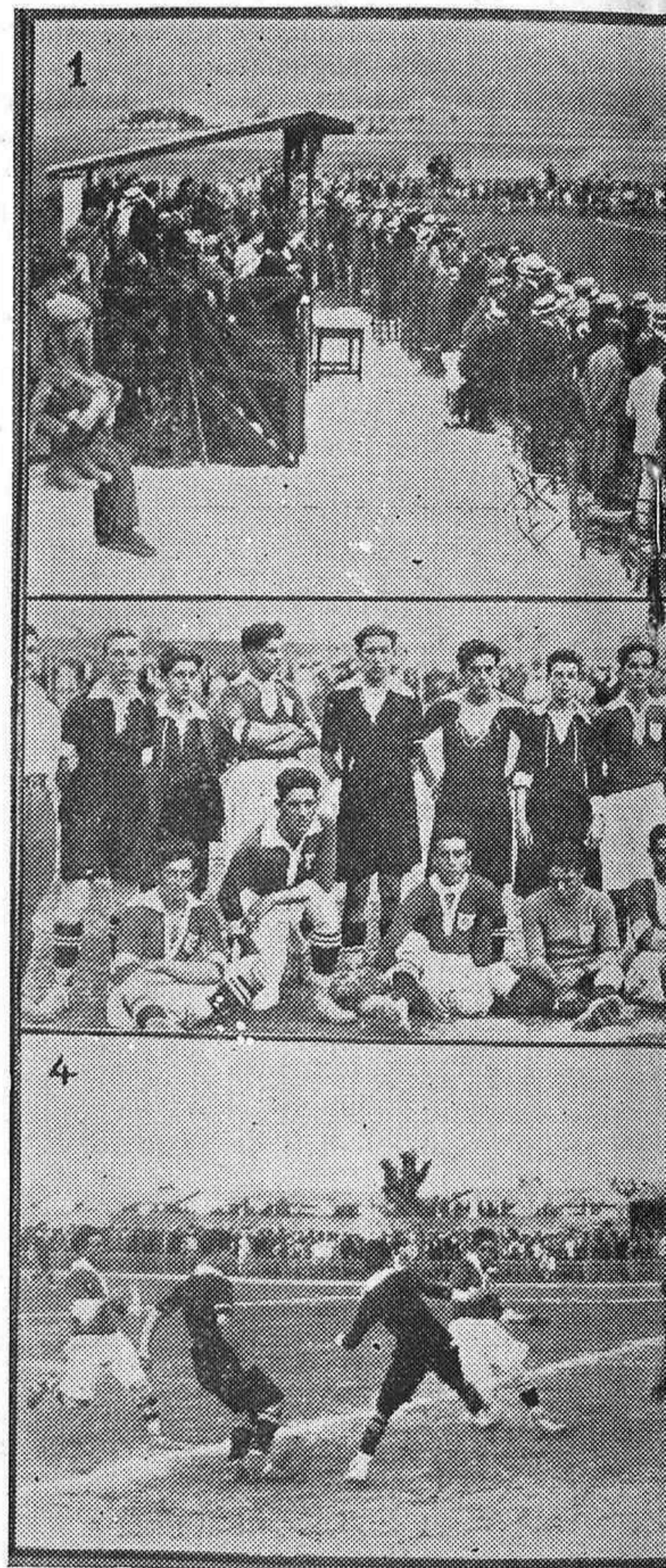
1 Tribuna presidencial.-2, 4 y 5 Los momentos de má

EL STADIUM ELECTRO-MECÁNICA Mide el terreno de 100 metros de largo, por 50 metros de ancho.