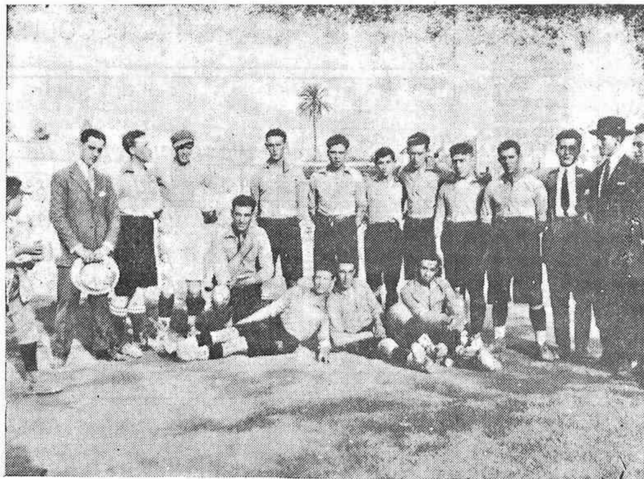
LA GIMNÁSTICA DE TRIANA.—Notable "teams" sevillano que el pasado domingo, a pesar de ser vencido por el Real Sporting, mostró en esta su gran clase.

El saque de honor lo lanzó el conzul de Portugal.