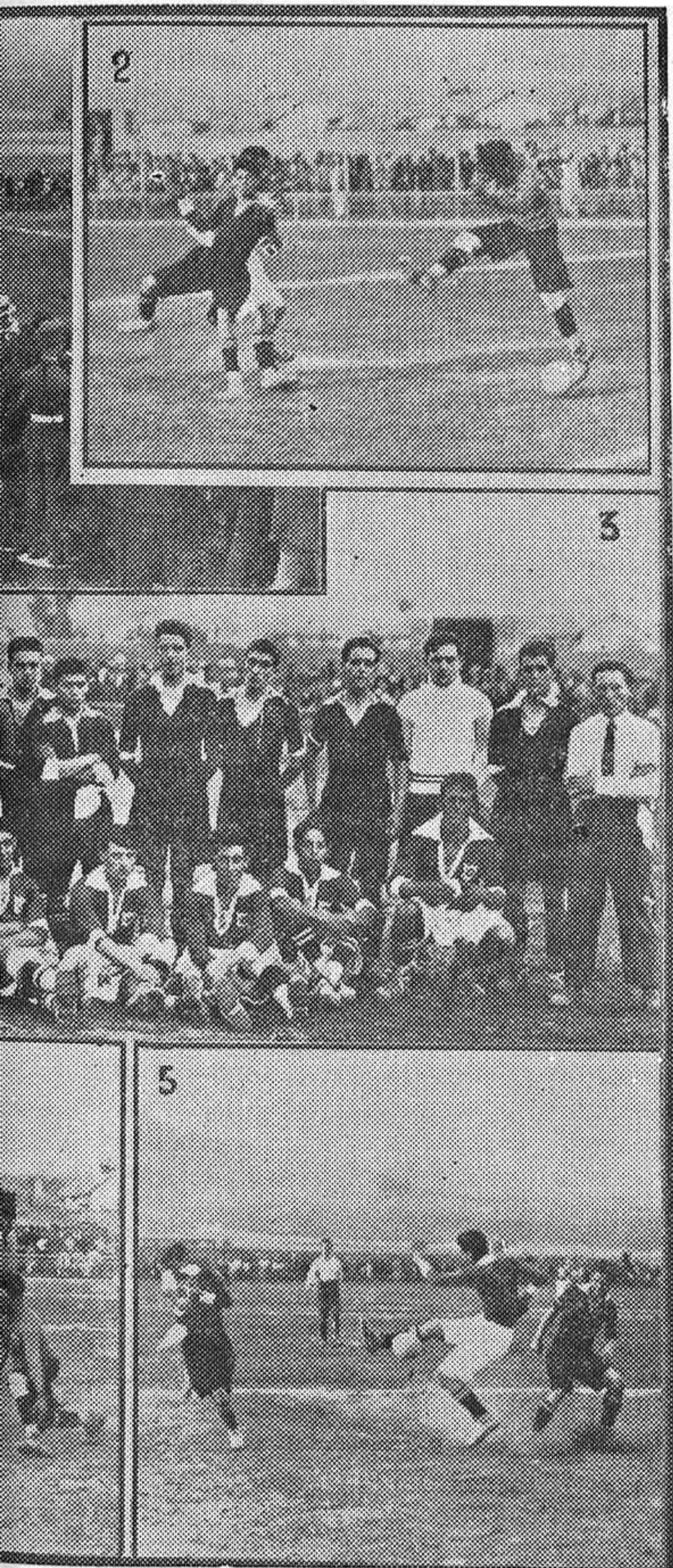
Interés del encuentro, y 3 Los equipos contendientes

Emplean los egabrenses un buen juego, que les permite llegar con el balón hasta