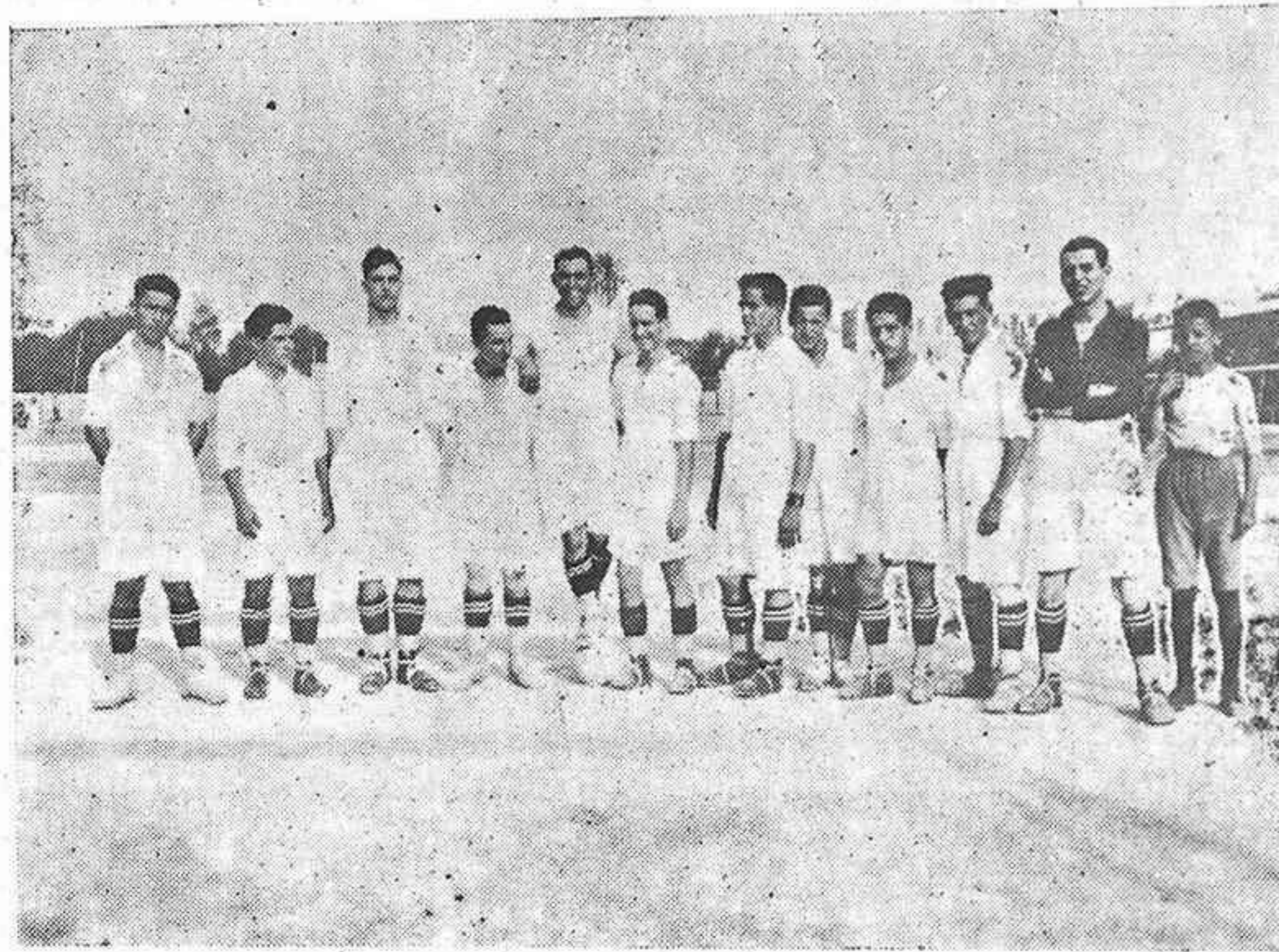
El primer «teams» del Real Córdoba Sporting Club, que en interesante encuentro venció el pasado domingo al «Gimnástica de Triana»