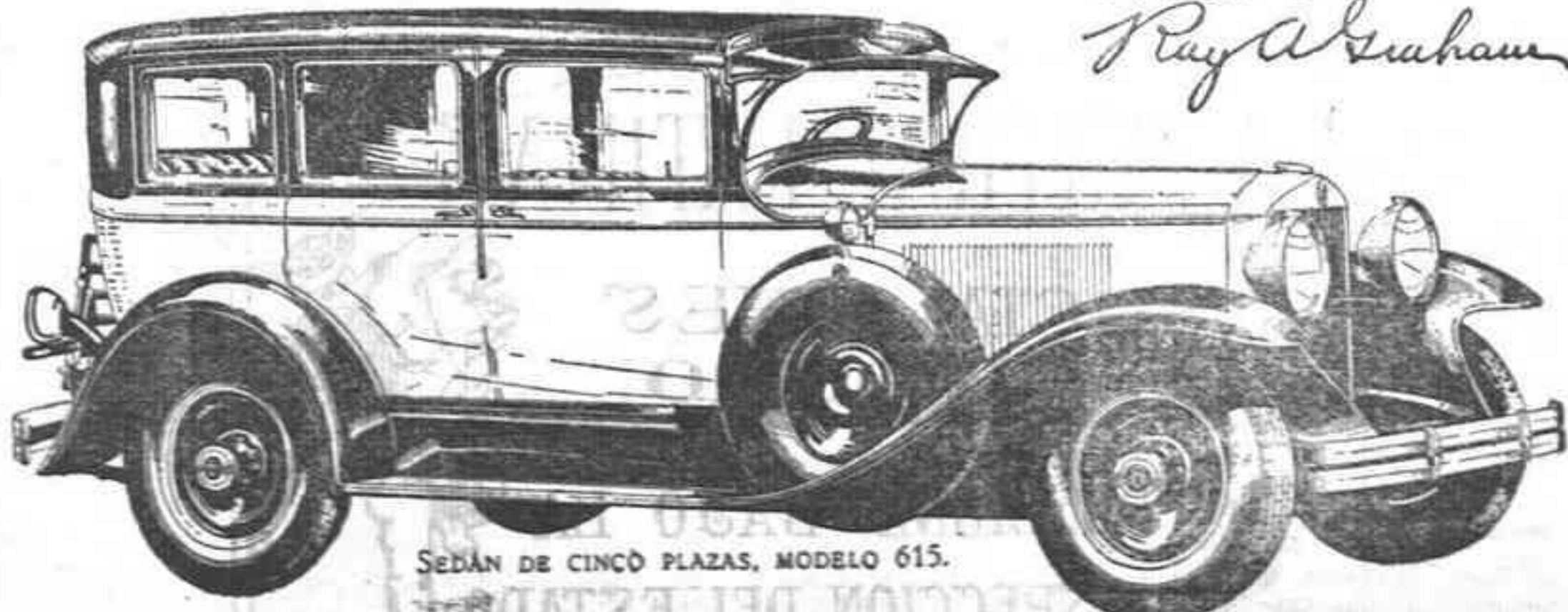
SEDÁN DE CINCO PLAZAS, MODELO 615.