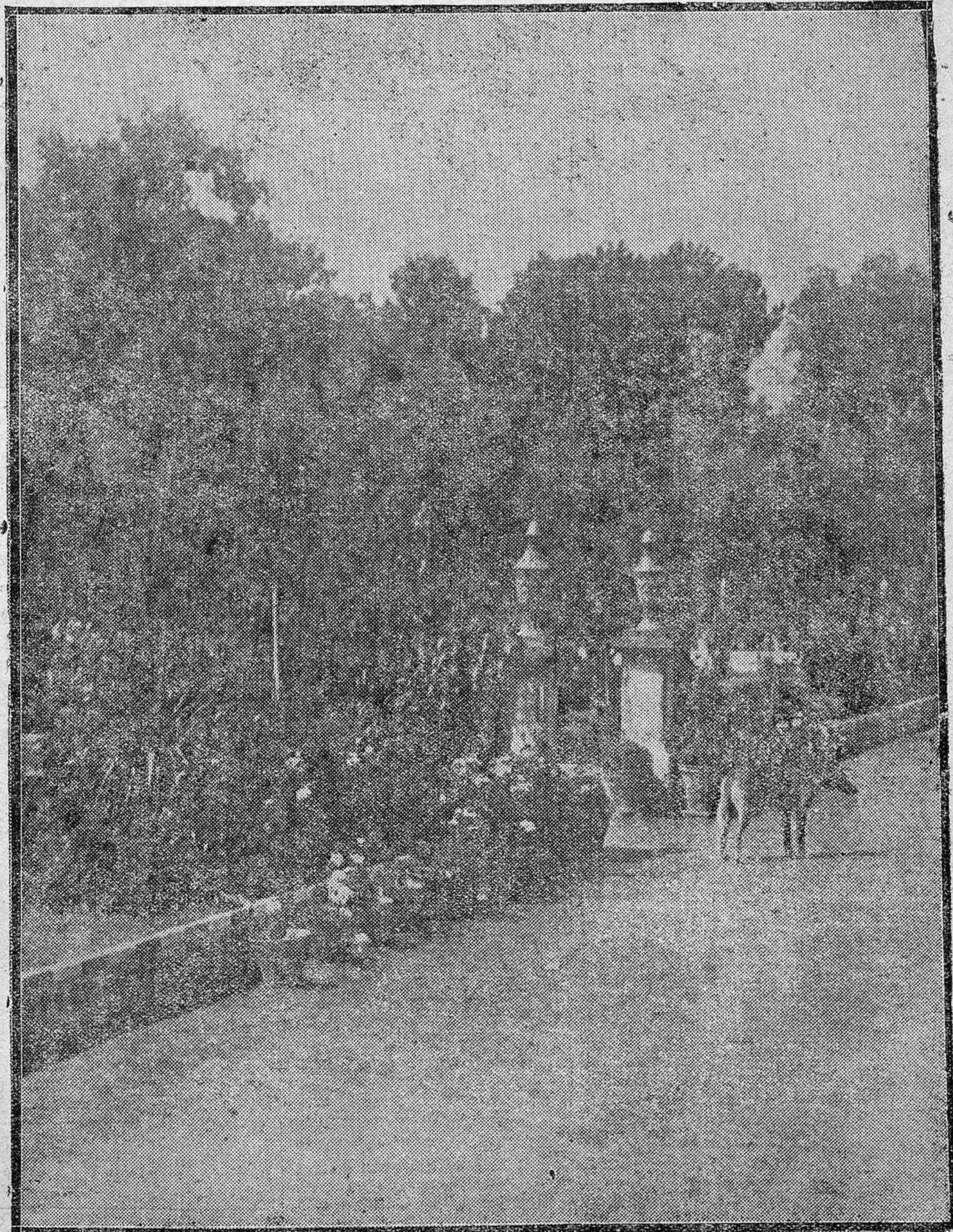
Jardín de una finca de nuestra Sierra