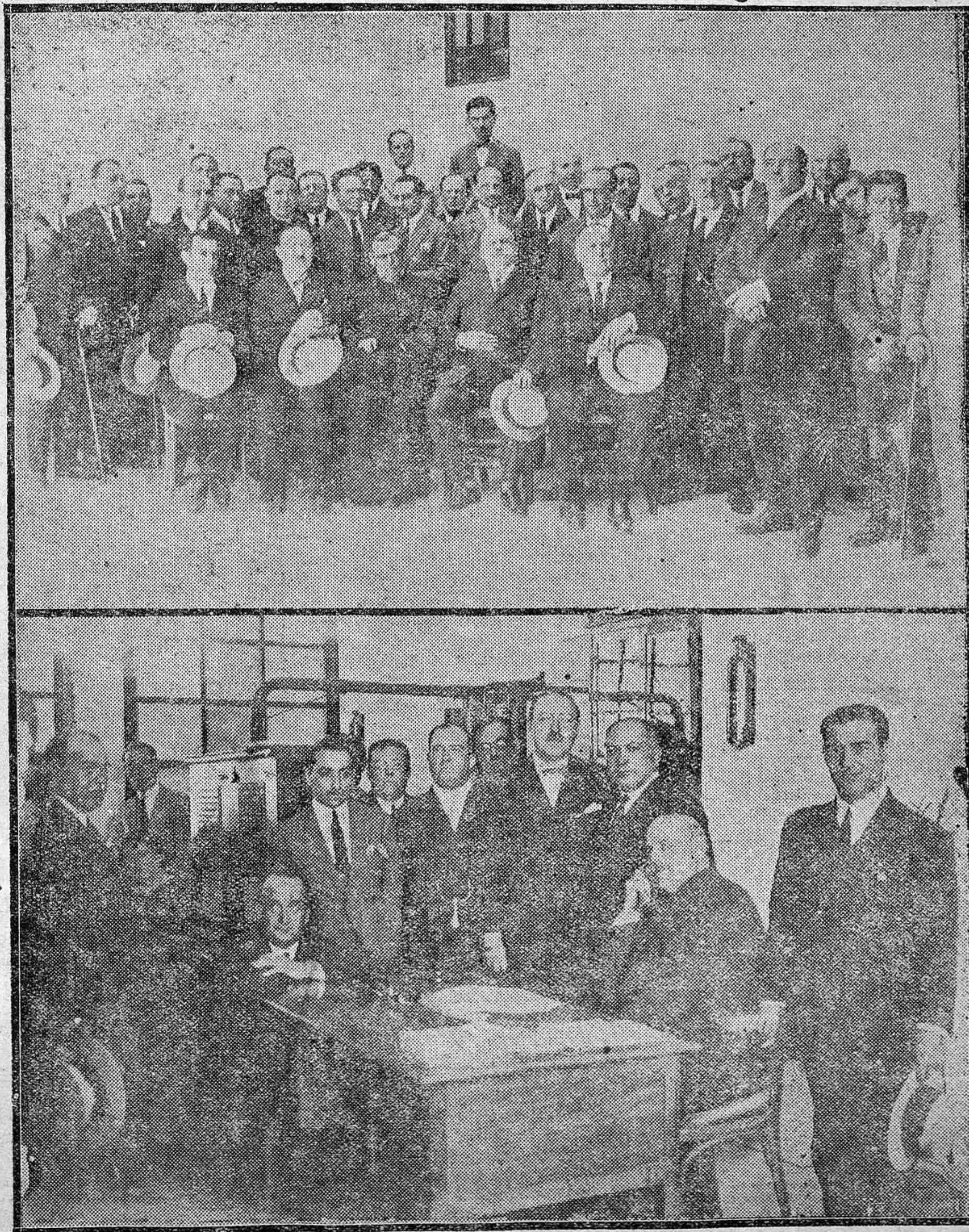
INAUGURACIÓN OFICIAL DE LA CENTRAL TELEFÓNICA DE CABRA.--Grupo de invitados al solemne acto.---Los señores Gobernador civil y Presidente de la Diputación en el acto de la inauguración.