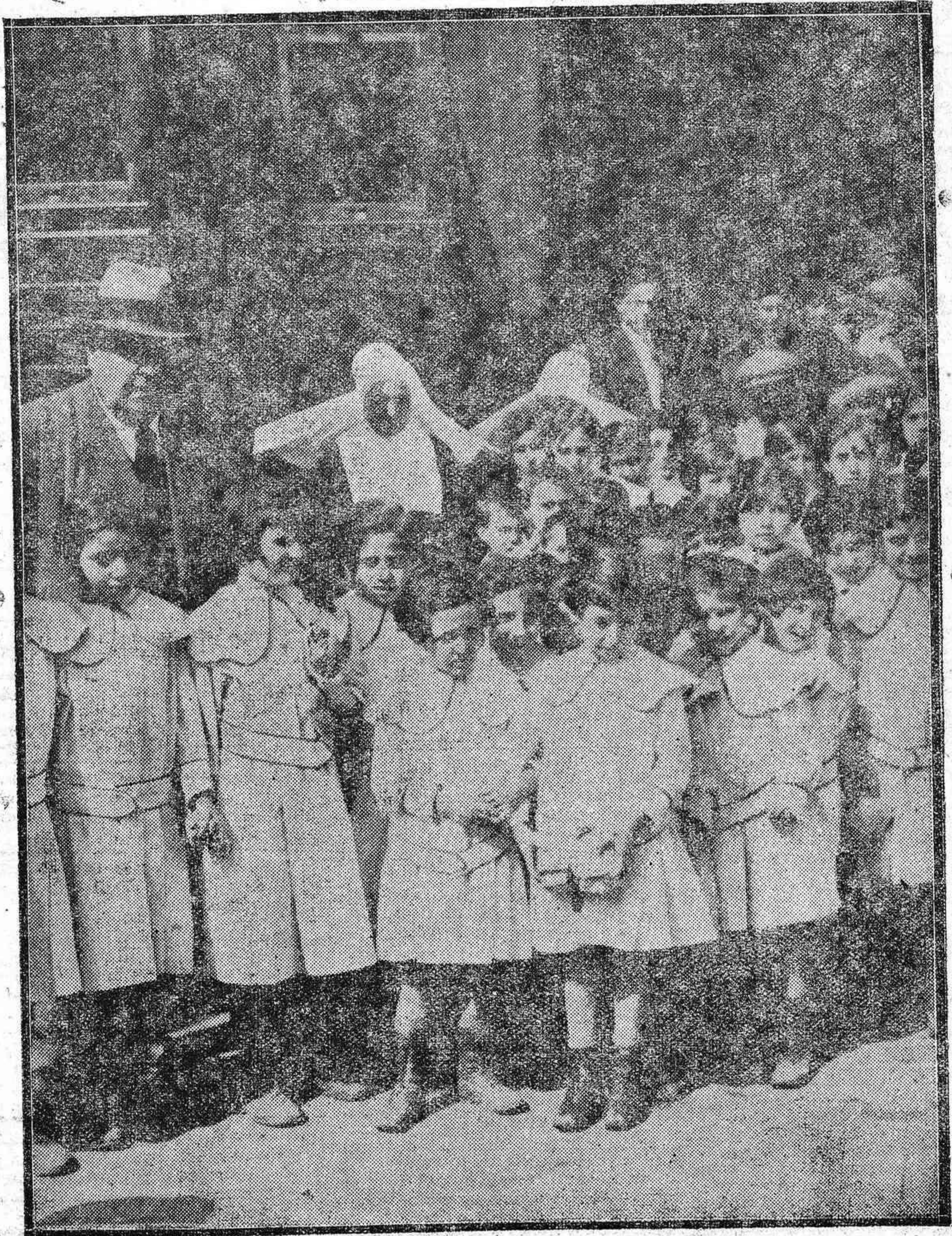
EN PRO DE LOS DESVALIDOS. --Primera colonia infantil de salud compuesta por expósitos, que la Excm. Diputación envió ayer al Cerro Muriano.