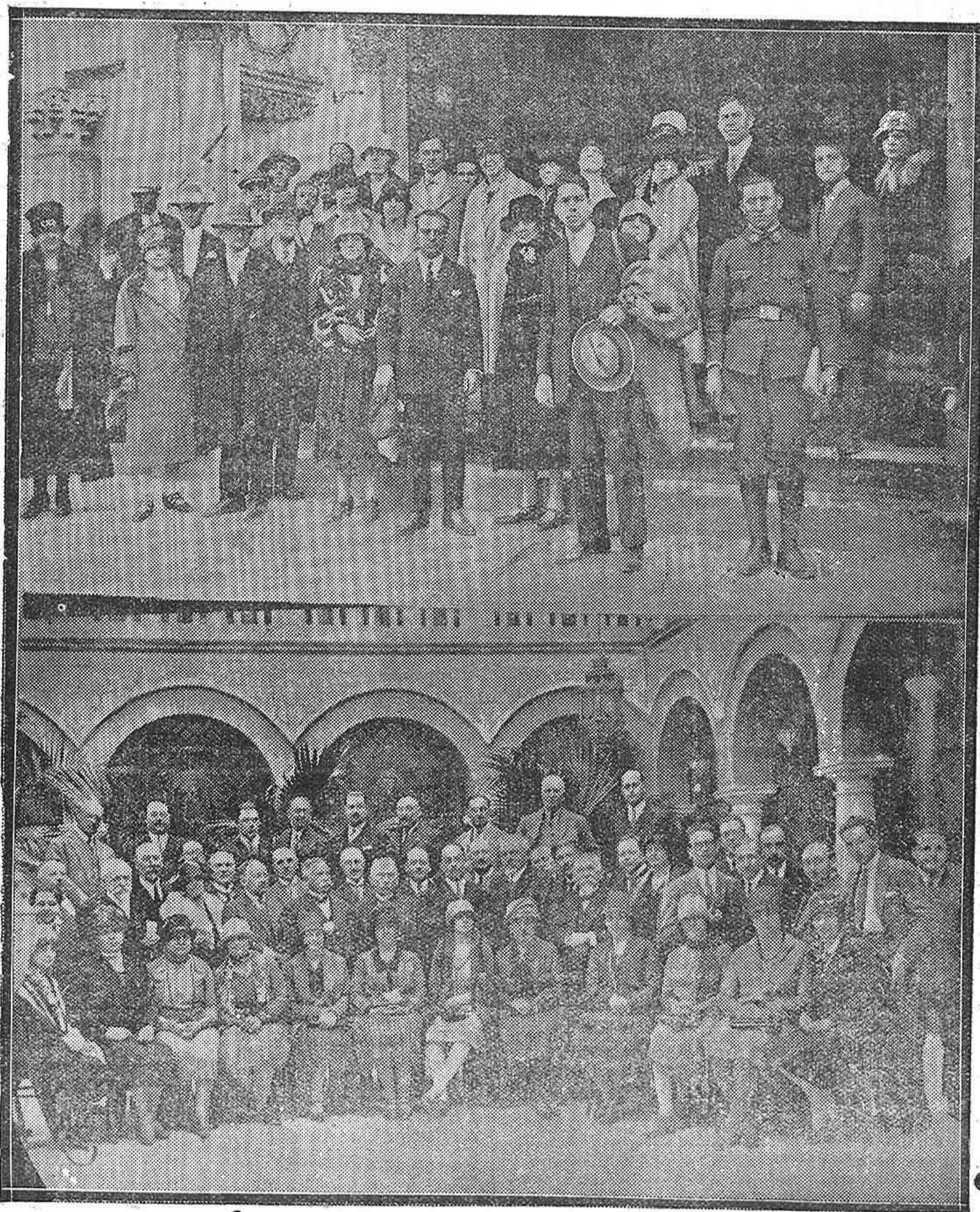
NUESTROS HUÉSPEDES DE UN DIA. —Grupo de turistas norteamericanos al salir de admirar nuestra Mezquita-Aljama.—Los profesores médicos belgas, con las señoras y señoritas que formaban parte de la expedición congregados en el hermoso patio central de nuestro Círculo de la Amistad.