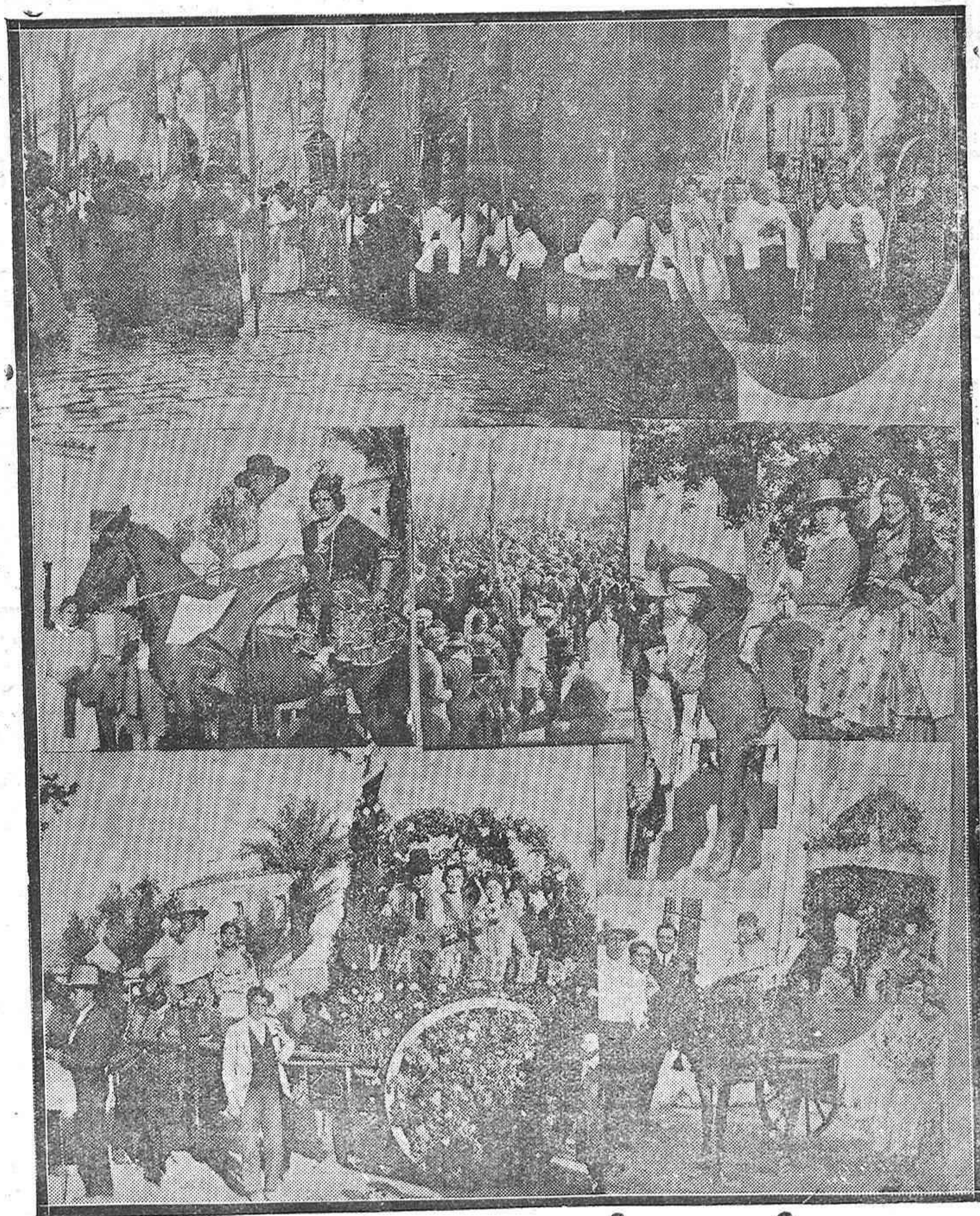
LA FESTIVIDAD DEL DOMINGO DE RAMOS.—Dos aspectos de la procesión de las palmas celebrada en la Catedral.—LA ROMERÍA DE SANTO DOMINGO: Los dos primeros premios de parejas a caballo.—Los carros adornados que obtuvieron el primero y el segundo premio.